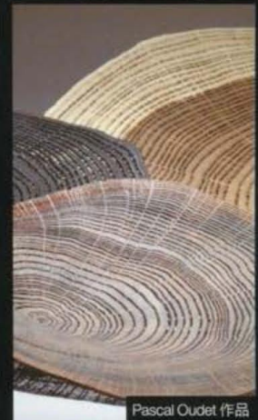
Pascal Oudet 作品