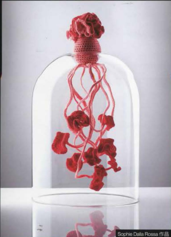
Sophie Dalla Rossa 作品