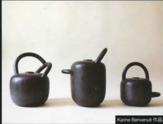
Karine Bervenuti 作品