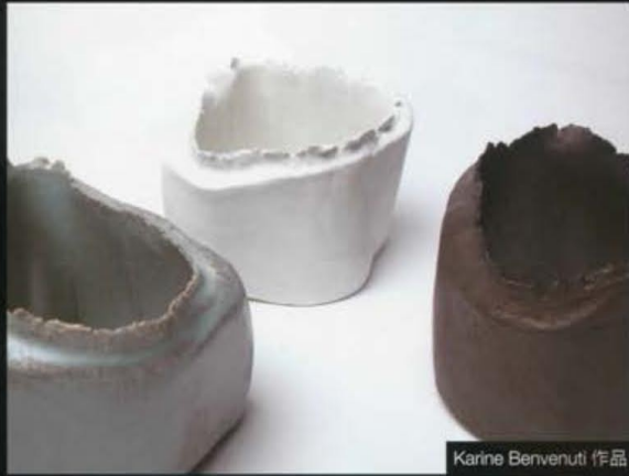
Karine Bervenuti 作品